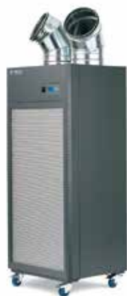
QleanAir FS 70