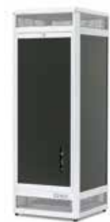
AirQlean Low 115