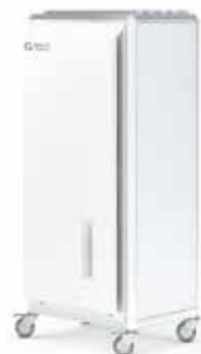
QleanAir FS 30